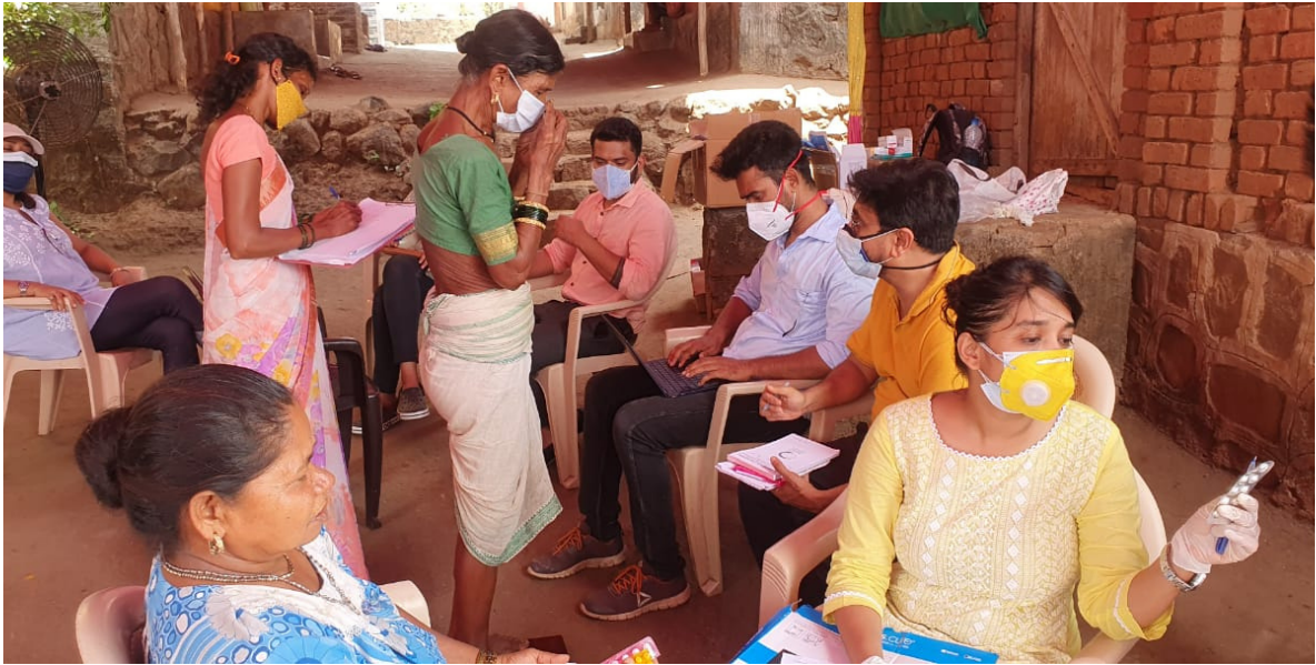
Volunteers distributing medicines to the tribals