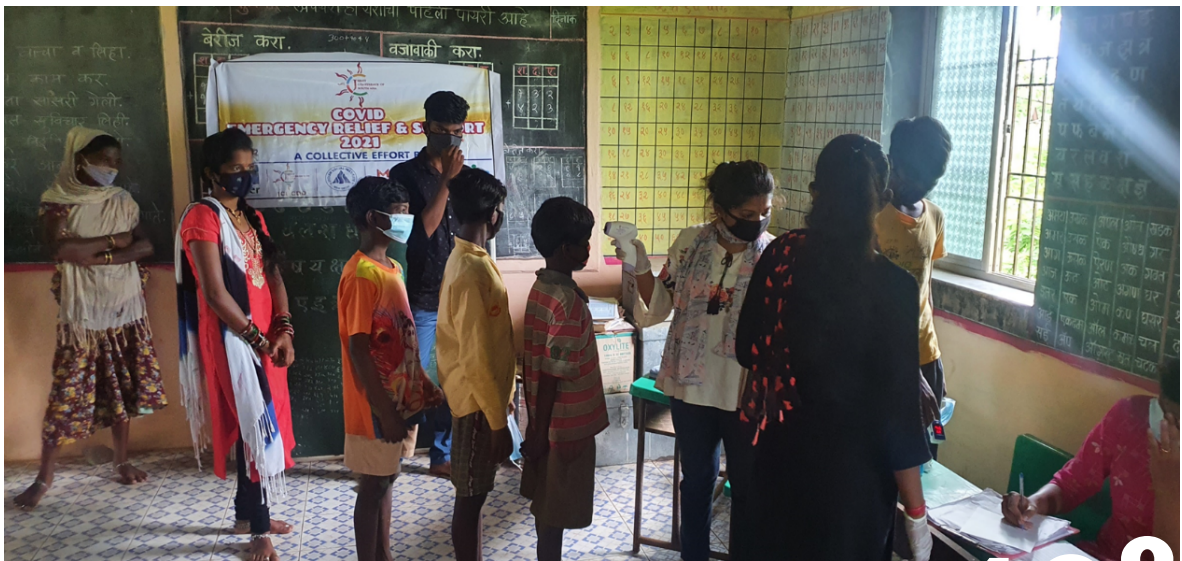
Distributing medicines to the tribals